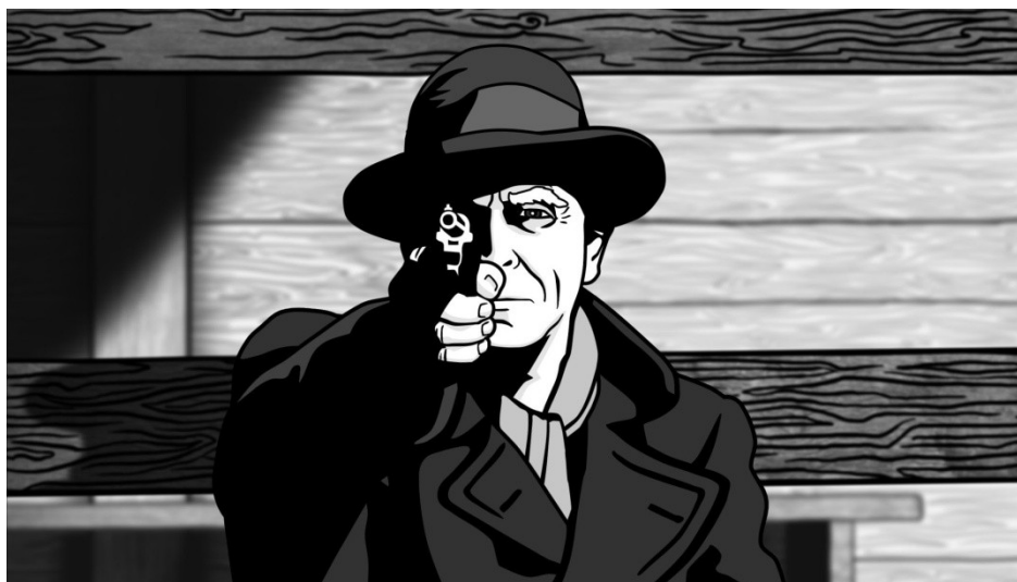
ROZHOVOR S NOROM DRŽIAKOM (koproducent, Supervízor animácie a vizualizácie)

Je to příběh rána, kdy mlha postupně opadá, a my můžeme zahlédnout krajinu.